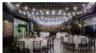
Город Киров Лофт-пространство Studio 101