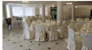
Город Смоленск Банкетный зал Дубрава