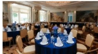
Город Санкт-Петербург Банкетный зал Резиденции K2