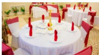
Город Киров База отдыха Пеликан