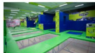
Город Уфа Батутный парк "Полет"