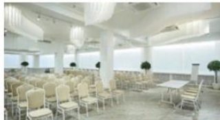
Город Пермь White Hall банкетный зал