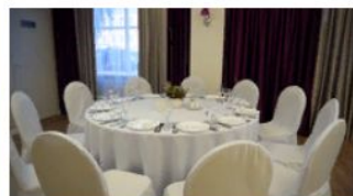
Город Пермь Отель Амакс