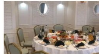
Город Казань Банкетный зал Тетюшского Райпо